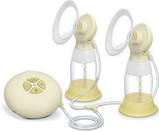
Medela Salıncak Esnekliği