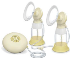
Medela Swing Flex